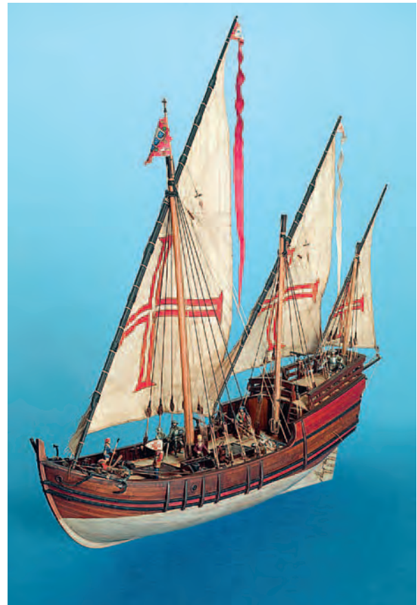
Portugiesische Karavelle, um 1450

Dieses Instrument zur Orientierung auf See wurde in einer Zeit populär, als die Menschen begannen, sich zunehmend auch anderweitig neu zu orientieren. Im 15. Jahrhundert begann sich die bis dahin bekannte Welt radikal zu verändern: Die Ideen des Humanismus lösten die Gedankenwelt des Mittelalters ab, der Mensch rückte mehr und mehr in den Mittelpunkt der Welt und wurde zum selbstverantwortlichen Individuum. Neue Informations- und Kommunikationstechniken wie der Buchdruck halfen, die neuen Ideen zu verbreiten. Die Welt weitete sich. Seefahrer hatten auf neuen Wegen neue Länder bereist und von dort neue Waren und Geschichten mitgebracht. In Kunst und Architektur war die Zentralperspektive wiederentdeckt worden, der Mensch stand nun in der Mitte einer neuen, großen Welt. So, wie der Mensch sich in dieser neuen Welt zurechtfinden musste, musste der Seefahrer seinen Standort in den grenzenlosen Weiten des Ozeans wissen. Dazu dienten ihm Instrumente wie das Seeastrolab, der Quadrant und auch der Jakobsstab oder der Davis-Quadrant. Die Notwendigkeit einer verbesserten Navigation wurde zu einer Herausforderung an die Entwicklung immer besserer technischer Instrumente. Mithilfe eines mathematischen Systems positionierte sich der Mensch in der Welt.