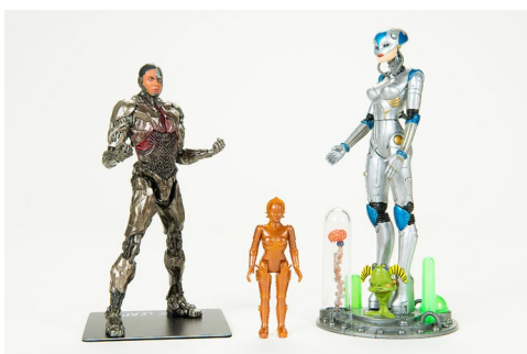
Cyborg-Combo. Ob Maria aus „Metropolis“, Cyborg aus der „Justice League“ oder Bionica: Die Popkultur ist bevölkert von einzigartigen Sci-Fi-Wesen.