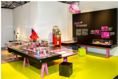
Der neue Ausstellungsbereich BODY in der Ausstellung „Das Netz. Menschen, Kabel, Datenströme“.

Kostenfreie Verwendung unter Angabe der Fotocredits nur im Zusammenhang mit der Berichterstattung über den neuen Ausstellungsbereich „BODY“ in der Ausstellung „Das Netz. Menschen, Kabel, Datenströme“.