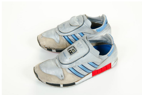
Selbstvermessung on the Go: Mit dem „Micropacer“ konnten Jogger erstmalig ihre Leistungsdaten tracken.